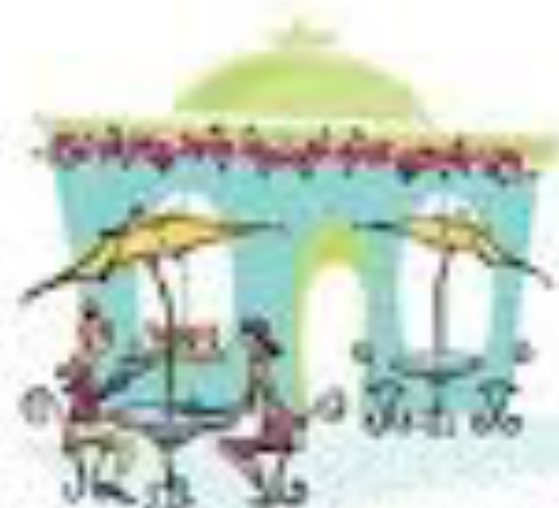
Une table occupée une table libre